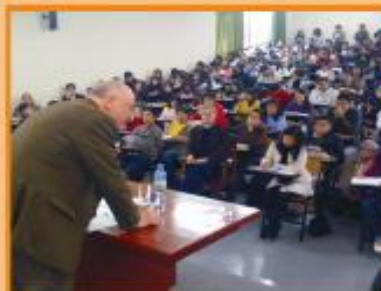
EL DOCTOR ROBERT ALEXY EN EL AULA 235 DANDO UNA CLASE A MAS DE 250 ALUMNOS

Plasmando nuestra visión de llevar los mejores profesores a las aulas sanmarquinas, concertamos con el profesor multi honoris causa Dr. Robert Alexy, una clase en el aula 235 de la Facultad. Para nosotros fue un sueño hecho realidad tener en una clase como profesor a Robert Alexy, con un aula abarrotada con más de 250 alumnos, donde se confundían entre las sillas estudiantes de todos los años y docentes sanmarquinos, dicha clase magistral quedará en el recuerdo, como ejemplo, de todos los que estuvimos presentes, de los que pudieron preguntar, de los que leímos sus libros, de los que siempre queremos un San Marcos mejor.