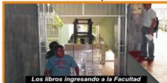
Los libros ingresando a la Facultad

"Agradecemos a todos aquellos que hicieron realidad lo imposible"