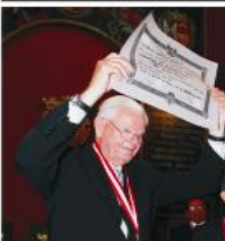
DR. CLAUS ROXIN CELEBRANDO SU GRADO DE DOCTOR HONORIS CAUSA OTORGADO POR SAN MARCOS