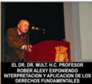
EL DR. DR. MULT. H.C. PROFESOR ROBER ALEXY EXPONINDO INTERPRETACION Y APLICACION DE LOS DERECHOS FUNDAMENTALES