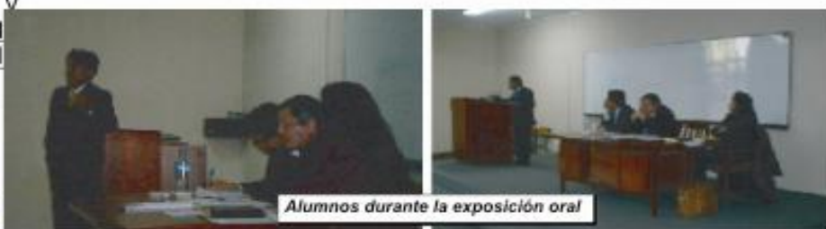
Alumnos durante la exposición oral