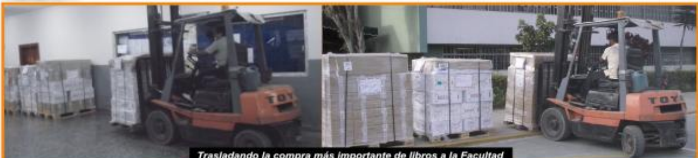
Trasladando la compra más importante de libros a la Facultad

5584 los títulos que se incluyeron en nuestra biblioteca con esta nueva compra