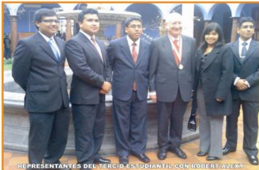
REPRESENTANTES DEL TERCIO ESTUDIANTIL CON ROBERT ALEXY