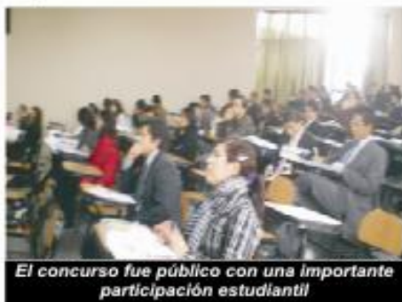
El concurso fue público con una importante participación estudiantil

Tal como lo propusimos el Tercio Estudiantil Mayoría en su labor de promover la investigación, en sesión del Consejo de Facultad aprobó la institucionalización del concurso de ponencias para que se realice cada año de forma institucional y ordenada, con ello se busca lograr la participación de todos los estudiantes.