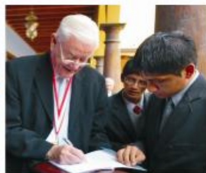
DR. CLAUS ROXIN CON ALUMNOS DE LA FACULTAD