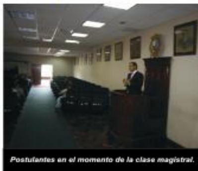
Postulantes en el momento de la clase magistral.