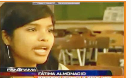
Entrevista en RADIOPROGRAMAS el día 19 de Junio del 2010