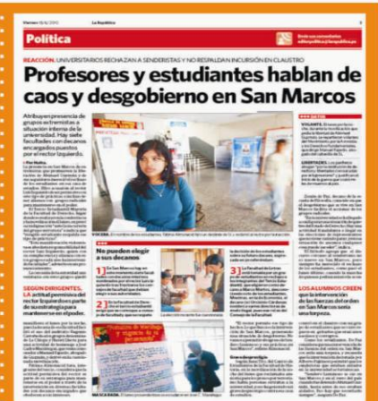
La representación estudiantil se pronuncia en los medios de comunicación debido a las amenazas presidenciales y rectorales de intervenir la universidad diario La República edición del 18 de Junio del 2010