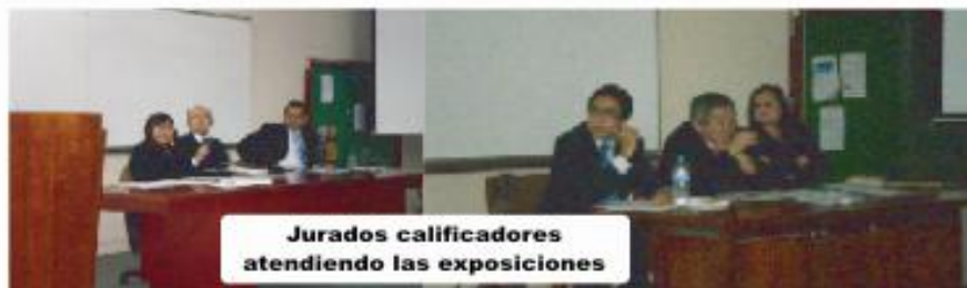
Jurados calificadores atendiendo las exposiciones

Asimismo, de acuerdo a nuestra propuesta de implementar la Ayudantía de Cátedra para cursos electivos , que permite reforzar la orientación a la especialidad implementada en nuestro plan de estudios, este año, para la evaluación se agrupó los diferentes cursos en 6 jurados, cada uno conformado por docentes de comprobada calidad académica, especialistas en las materia y alumnos destacados. Devolviéndolo con ello el real sentido a la Ayudantía de Cátedra.